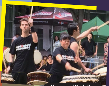
Kyouryu Wadaiko Drummers