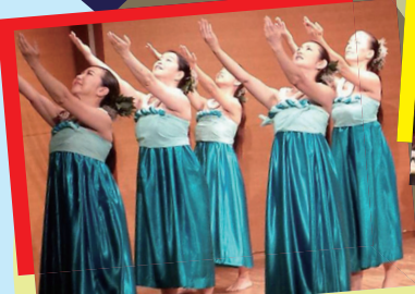
Halau Na Mamo O Pohai Kalima Dancers