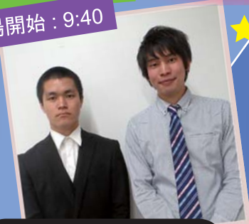
いがぐりボンバー Igaguri Bomber