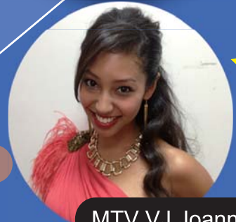
MTV VJ Joann